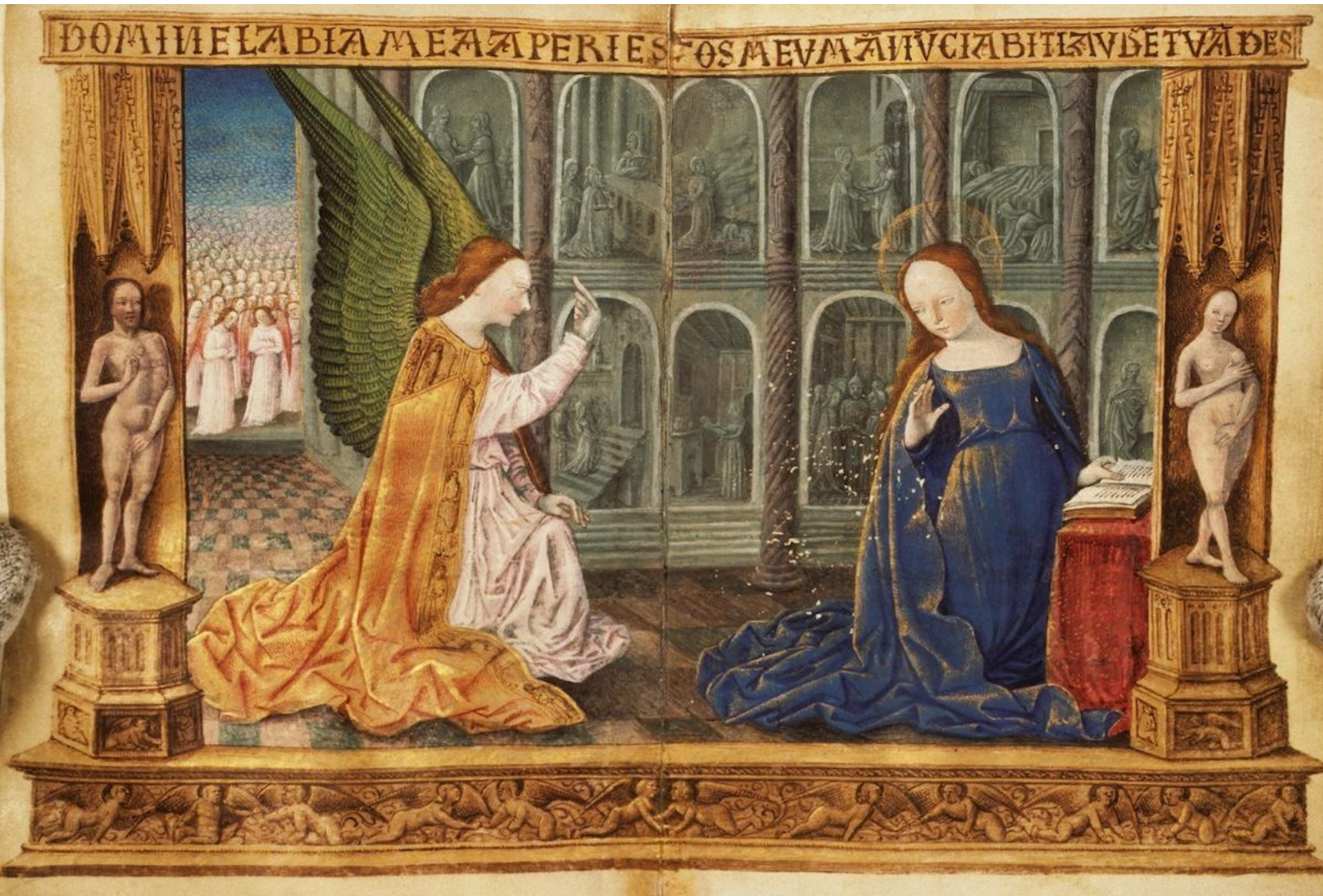
Figure 5: Annunciation, Hours of the Virgin, France, c. 1485-1490. New York, New York Public Library, MA 113, fols. 213v-214r.