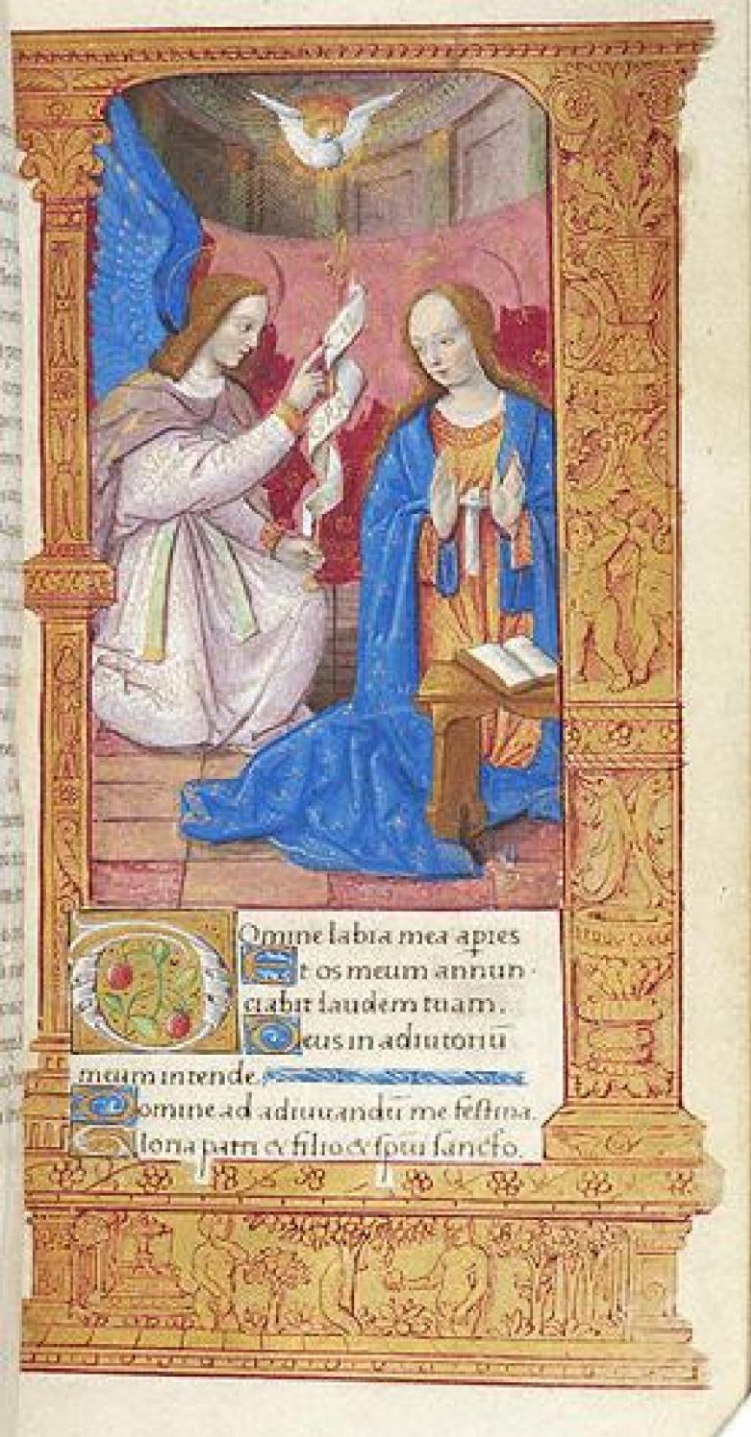
Figure 6: Annunciation, Hours of the Virgin, France, c. 1520. New York, Morgan Library, M.290, fol. 15r.