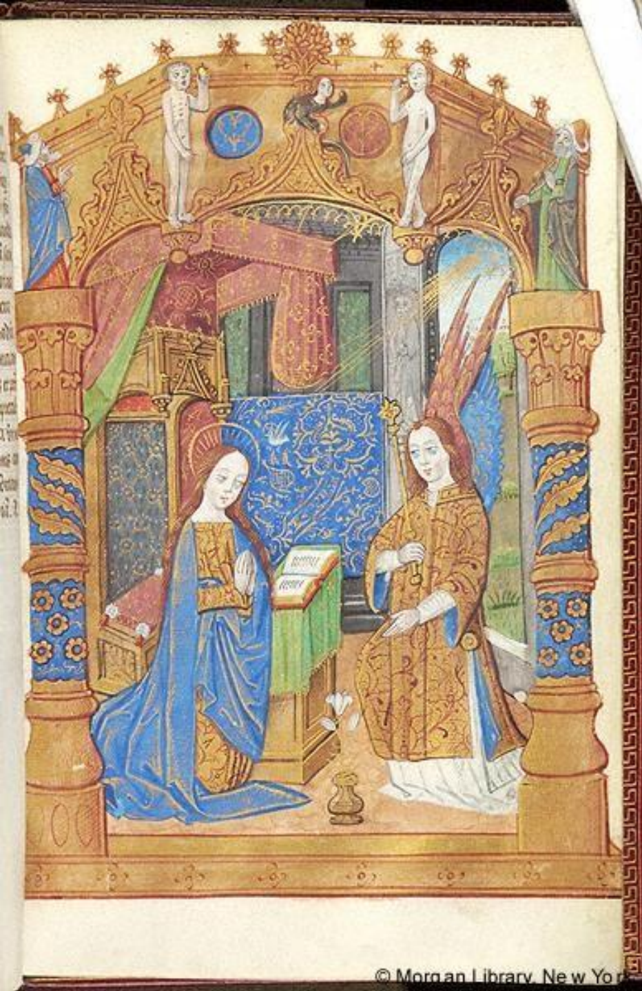
Figure 4: Annunciation, Hours of the Virgin, France, c. 1500. New York, Morgan Library, M.151, fol. 22r.