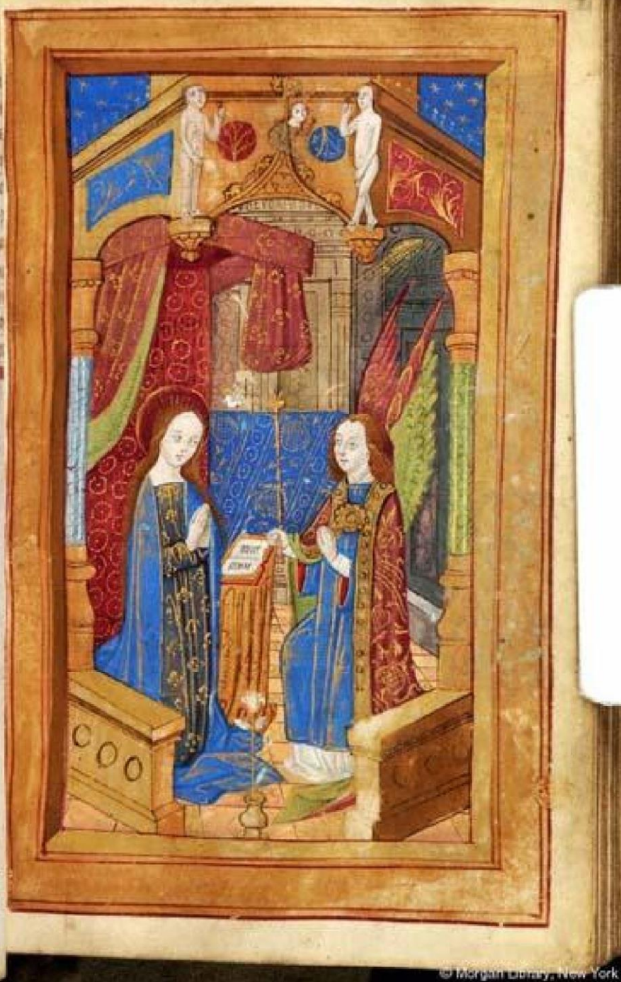
Figure 3: Annunciation, Hours of the Virgin, France, c. 1500. New York, Morgan Library, M.129, fol. 21r.