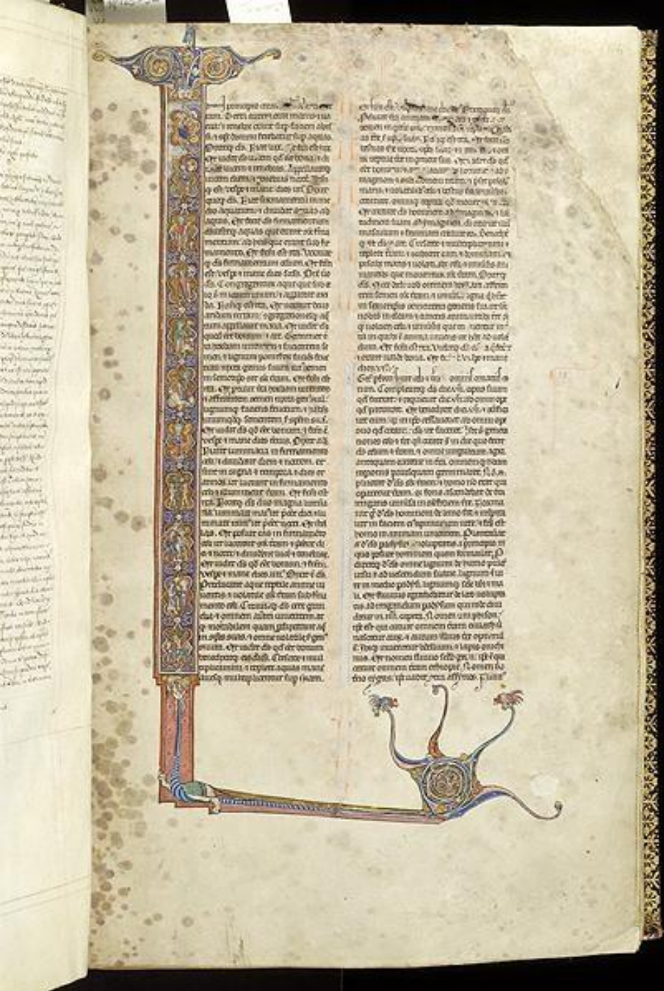
Figure 7: Initial, Genesis, England, c. 1265. New York, Morgan Library, G.42, fol. 6r.