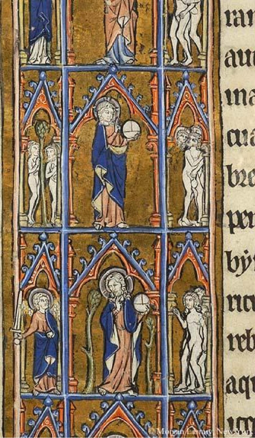
Figure 8: Detail: Fall and Exulsion, Genesis, Belgium, c. 1270. New York, Morgan Library, G.46, fol. 6v.