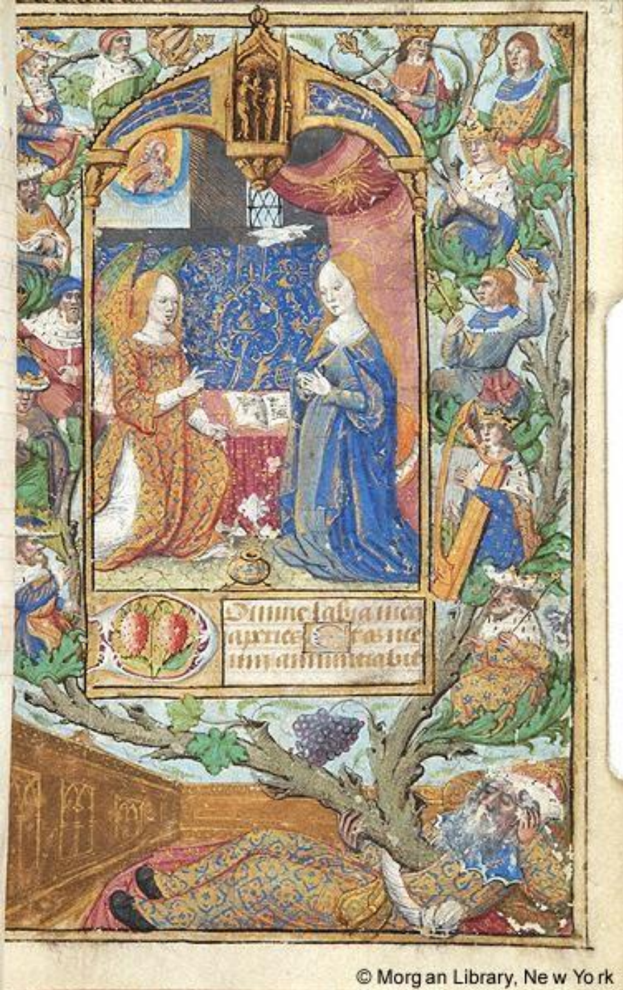
Figure 9: Annunciation with Tree of Jesse, Hours of the Virgin, France, c. 1500. New York, Morgan Library, M.175, fol. 21r.