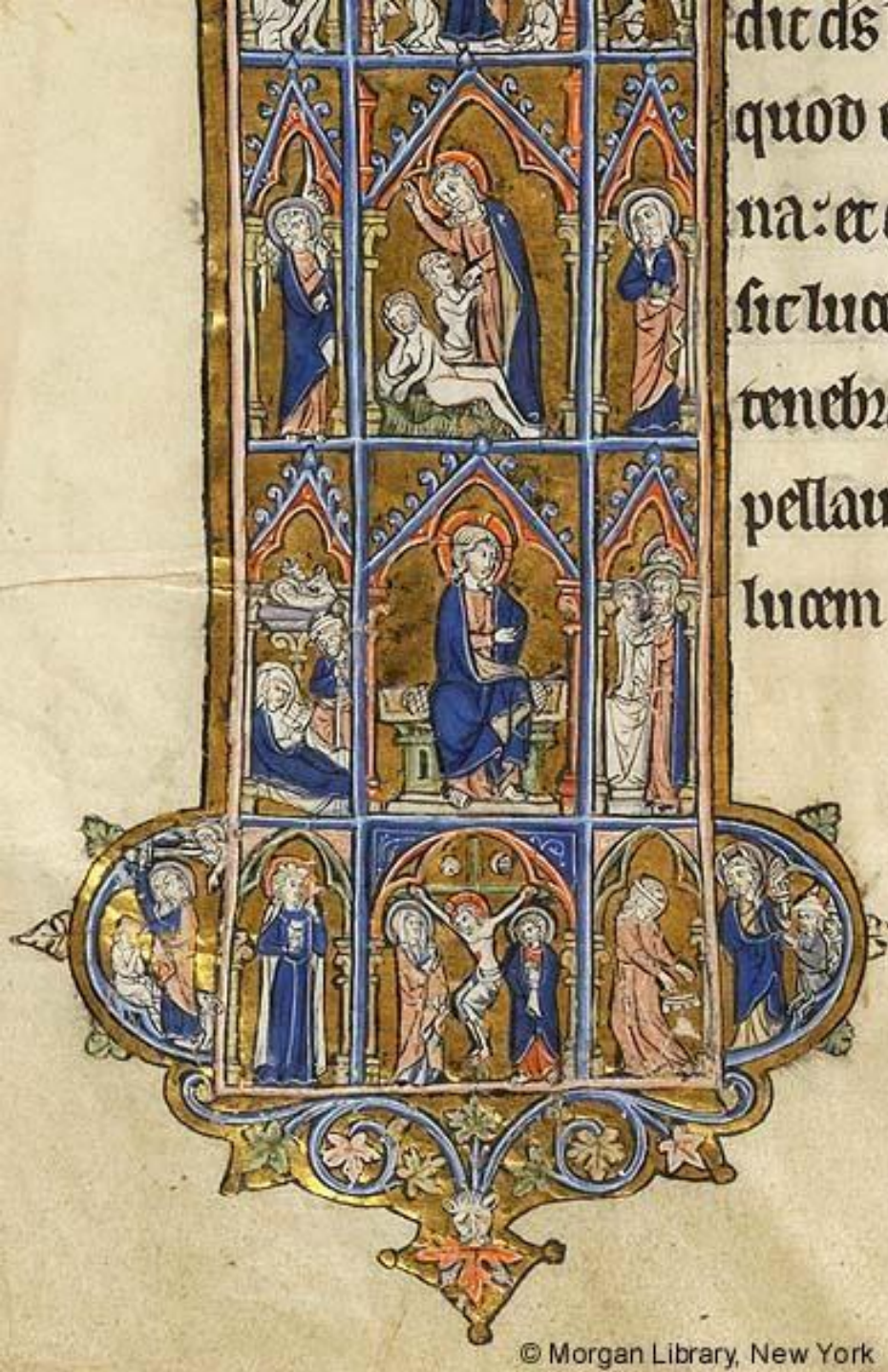
Figure 8: Detail: Creation of Eve, Annunciation, and Crucifixion, Genesis, Belgium, c. 1270. New York, Morgan Library, G.46, fol. 6v.