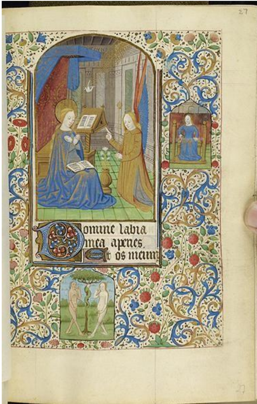
Figure1: Annunciation, Hours of the Virgin, France, c. 1460-1470. New York, Morgan Library, M.1160, fol. 27r.