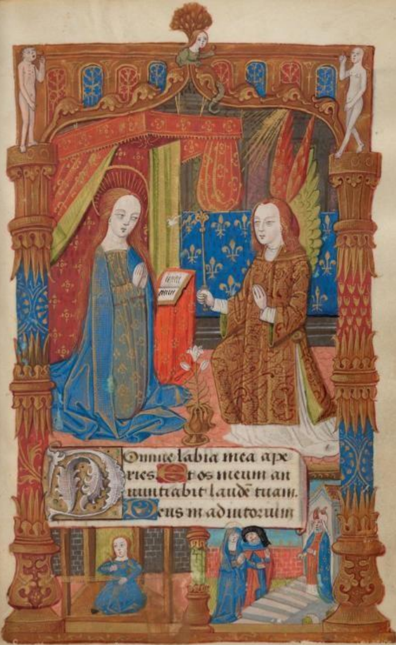
Figure 2: Annunciation, Hours of the Virgin, France, c. 1490- 1500. Princeton, Princetown University Library, Garrett 56, fol. 15r.